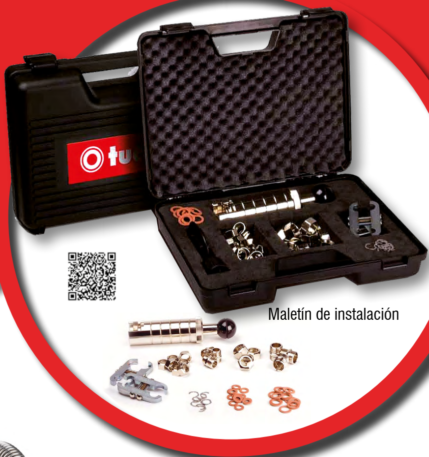
Maletín de instalación

Fabrique el flexo en la medida que necesite Instalaciones más rápidas y limpias