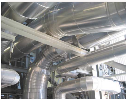
Calorifugado de grandes tuberías, calderas, hornos y equipos ROCLAINE