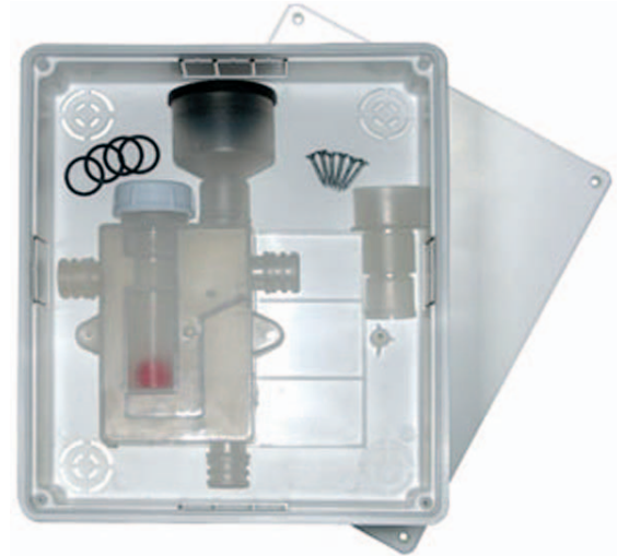
código: AS 03 940