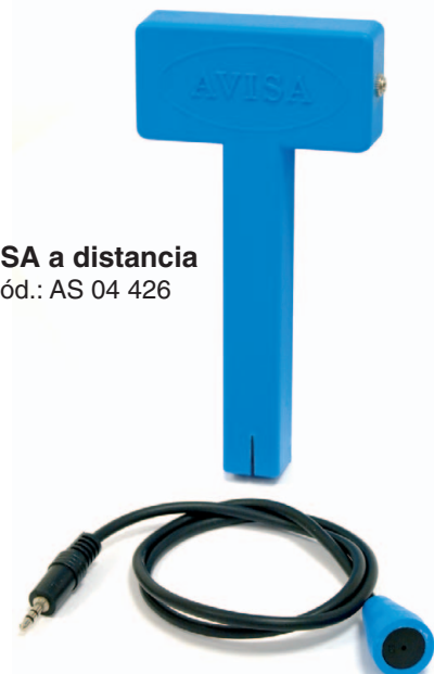
AVISA a distancia

Para el interior de la vivienda, el propio aparato emite la señal sonora. Para el exterior de la vivienda, el aparato lleva un cable de 700 mm con un terminal que conduce el pitido. Este cable sirve para que el recipiente de agua esté fuera de la casa (p. ej. en un balcón) y usted pueda oír el pitido en el interior de la vivienda.