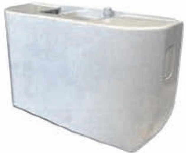
AS 06 140 AS 06 141