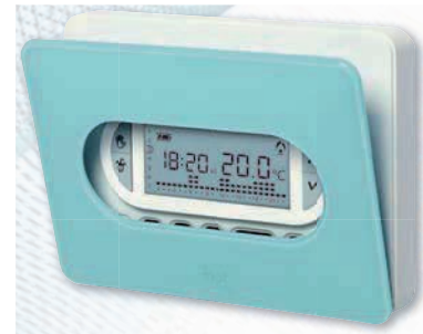
Color azul claro kristal