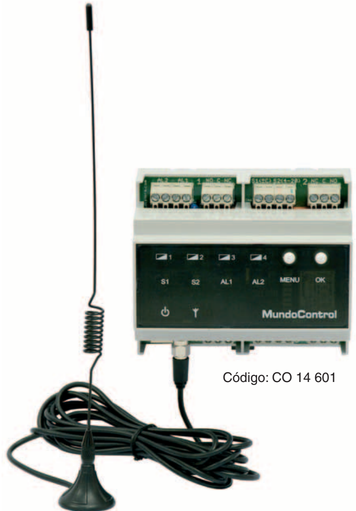
Código: CO 14 601