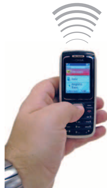
Controlará su DOMO-GSM con un simple SMS