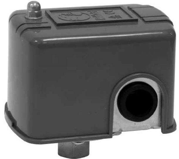
Cód. CO 18 435