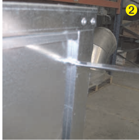
Desmontar tapa lateral