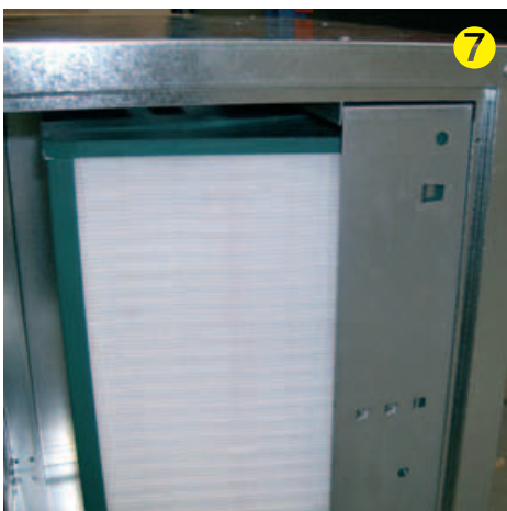
Comprobar correcta colocación del conjunto