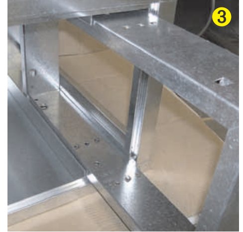
Extraer marco portafiltro CT