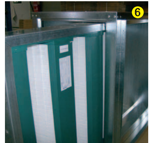
Introducir conjunto en contenedor