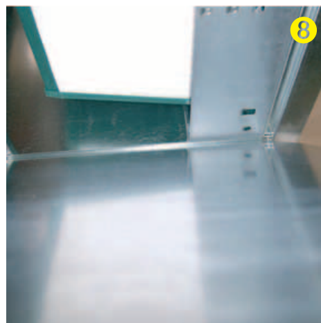
Montar tapa lateral