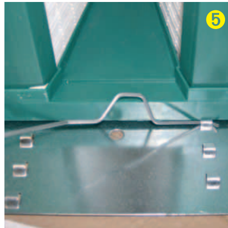
Fijar filtro con muelles