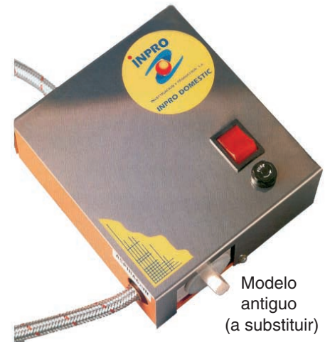
Modelo antiguo (a substituir)