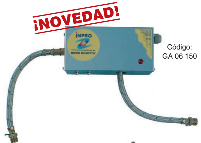
Código: GA 06 150