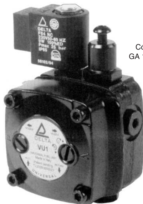
Código GA 15 060

El nuevo regulador de presión , situado en la parte superior de la bomba, permite el ajuste de la presión entre 6 y 18 bar, sin necesidad de substitución del resorte.