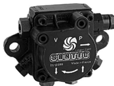
Diámetro del eje 8 mm para toda la serie