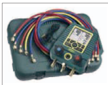
Completo con estuche