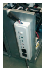
Detección de averías por LEDS