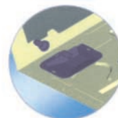
Doble sistema de desagüe