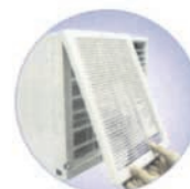
Panel de fácil desmontaje