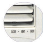
Renovación de aire