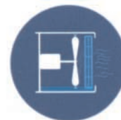
Gran caudal de aire