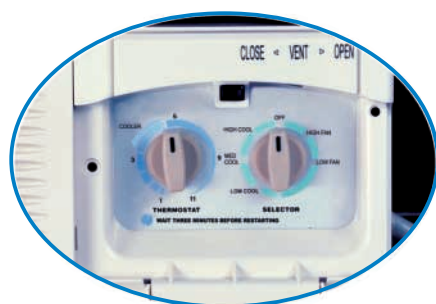
panel de mando