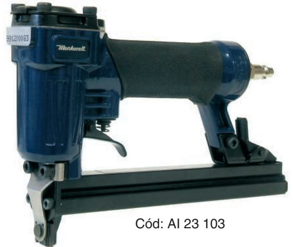
Cód: AI 23 103

Grapadora ideal para el montaje de conductos de fibra de vidrio, debido a su especial apertura de la grapa y a la comodidad en el manejo; siendo una herramienta imprescindible en el montaje de todo tipo de conductos "CLIMAVER". Con accionamiento mecánico, permite una alta velocidad de trabajo con el mínimo esfuerzo.