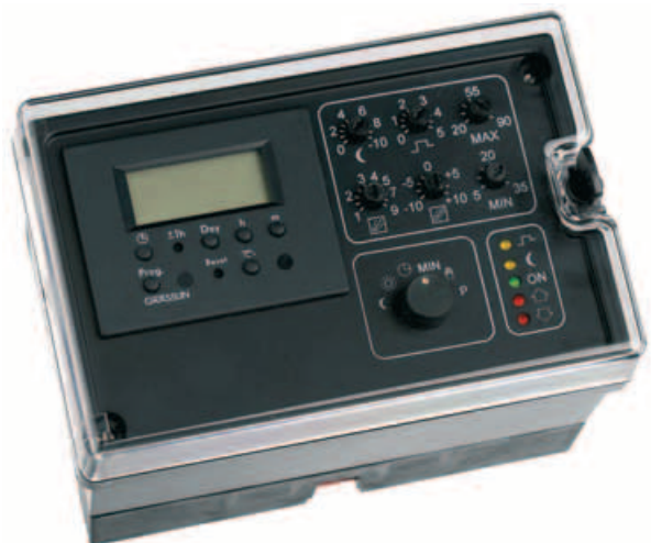
Regulador MC-100 reloj digital Cód. CO 10 202