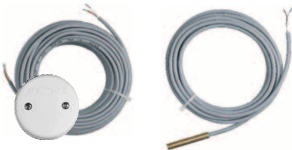
Sondas impulsión y exterior incluidas