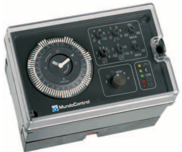
Regulador MC-100 reloj cuarzo Cód. CO 10 201