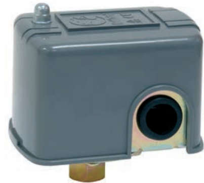
Cód. CO 18 435