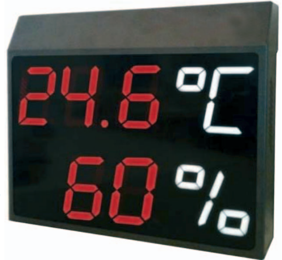
Código IM 16 301